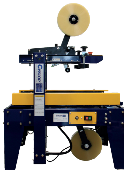
Standardversion vom CT 102 SD

Der CT 102 SD ist ein halbautomatischer Kartonverschließer der Einstiegsklasse. Er ist für 50 mm PP- oder PVC-Band gut geeignet. Nach dem Befüllen des Kartons faltet der Bediener die Klappen und führt den Karton manuell in die Maschine ein. Danach wird er unten und oben automatisch mit Klebeband verschlossen. Die Maschine lässt sich einfach manuell auf die gewünschte Breite und Höhe einstellen. Der Transport der Kartons erfolgt über motorisierte Seitenförderer, die die Kartons perfekt ausrichten und eine gute Abdichtung garantieren. Die Maschine wird standardmäßig ohne Förderbänder und Räder geliefert, diese sind selbstverständlich zusätzlich bestellbar. Mit der CT 102 SD ist es möglich, Hunderte von Paketen pro Tag professionell zu versiegeln.